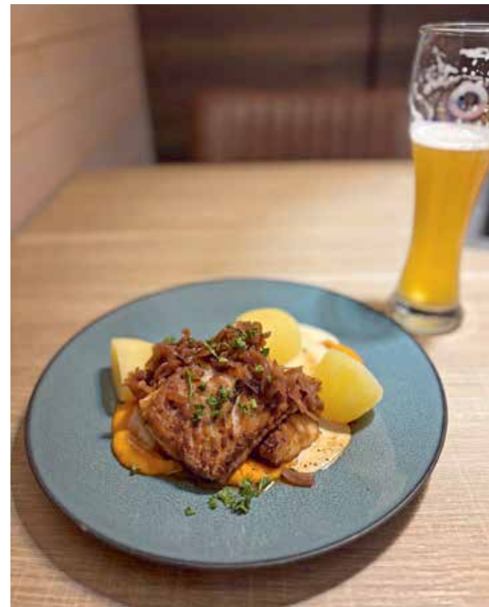
FESTSEI: En stor porsjon pannestekt høyrygg av sei servert med løkkompott og gulrotpuré koster 245 kr. Det er til å bli både mett og glad av.