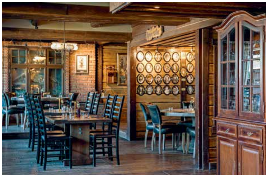
MINNERIKT: Interiøret i Rallarkroa er rikt på souvenirer fra rallartiden i Narvik.