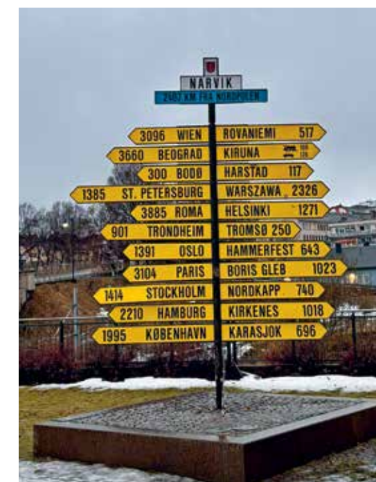
NORDLANDS NAVLE: Alle disse stedene kan man nå fra Narvik, enten med tog, fly eller bil.