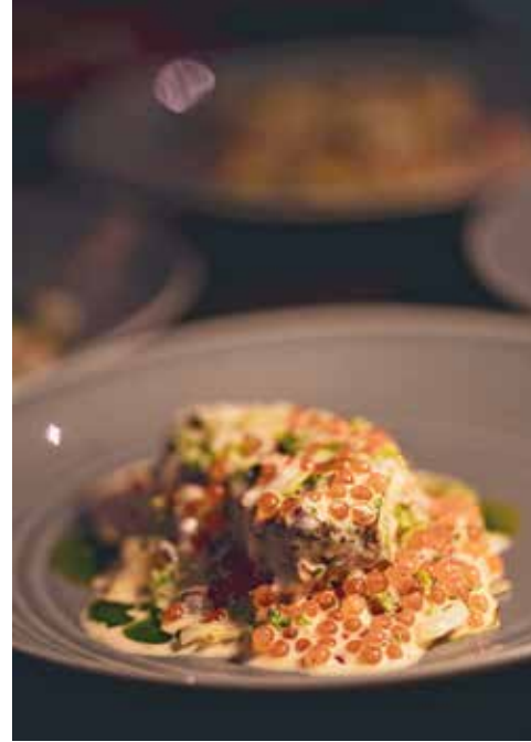
FESK MED SAUS: Egenfanget kveite på den prisbelønte kokken Vegard Stormos måte.