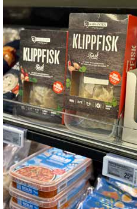
LOKALPRODUSERT: Fiskemat og frossen ferskfisk fra nærområdet.