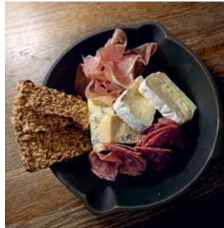
IKKE LOKAL: Ostene og spekematen er norsk, men ikke lokal, kan servitøren fortelle.