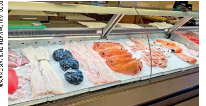
PLUKK SELV: Hvis du har mer lyst på en sprellfersk uer fra fiskedisken, tilbereder Fiskekrokens kokker gjerne det for deg, selv om det ikke står på menyen.