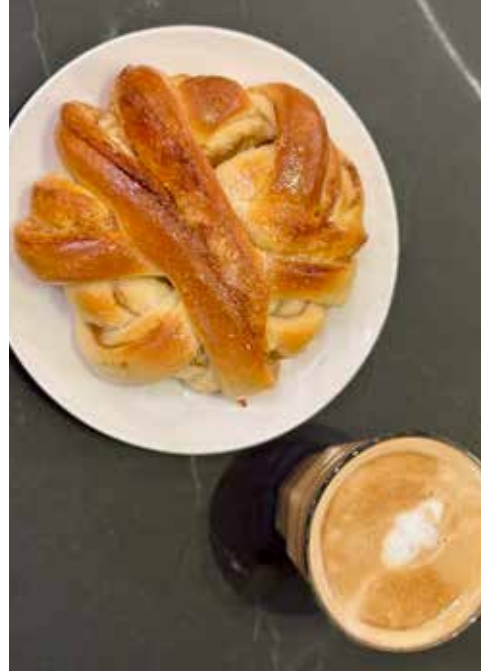
SØTT STOPP: Myklevolds kanelknote får 10 av 10 poeng.